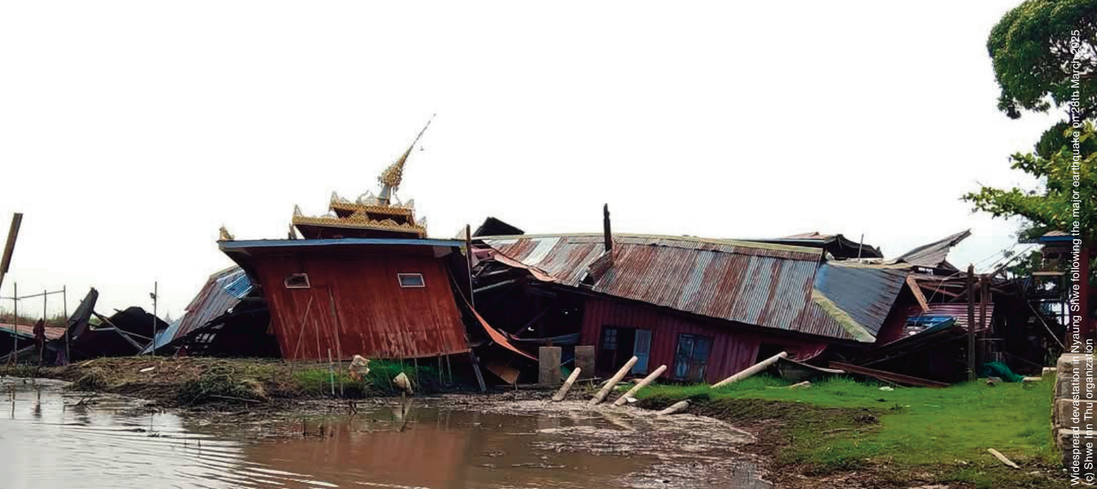
Widespread devastation in Nyaung U Shwe following the major earthquake on 28th March 2025