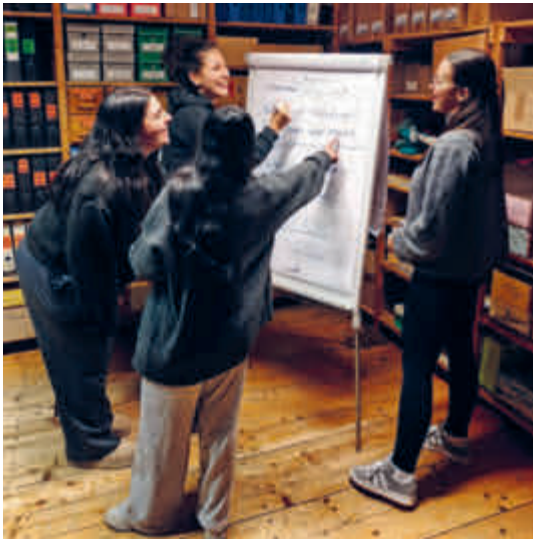
Die Schülerinnen der Social Media Gruppe arbeiten an kreativen Ideen für ein Video.