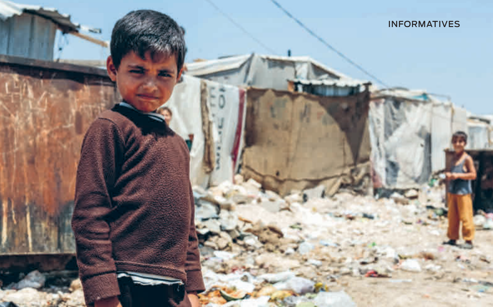
oben Ein Kind in einem Camp für syrische Geflüchtete im Libanon.

wurden. In Ländern mit besonders schweren Bildungskrisen wie Sudan oder Tschad beliefen sich die Einschnitte sogar auf bis zu 90 %. Mit Blick auf 2026 besteht die reale Gefahr, dass Bildung in Krisen weiter an den Rand gedrängt oder ganz aus den Planungen gestrichen wird. Dabei wissen die von akuten Notsituationen betroffenen Gemeinschaften, insbesondere die Kinder, seit langem: Bildung ist kein Luxus, sondern lebensrettend.