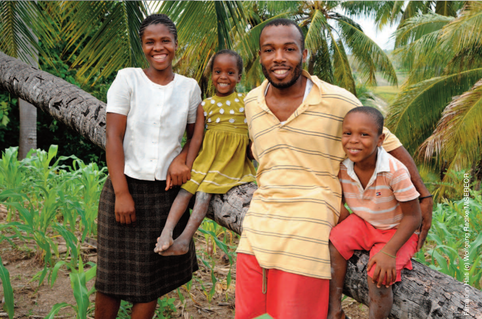
Familie in Haiti

45JAHRE 45 45 45 45 45 45 Entwicklungshilfe klub